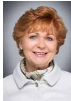
Barbara Havliza Niedersächsische Justizministerin